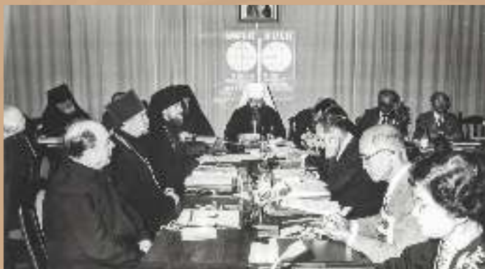
Конференция христиан СССР и Японии на тему «Укрепление мира в Тихоокеанском регионе» г. Минск, 1987 г.