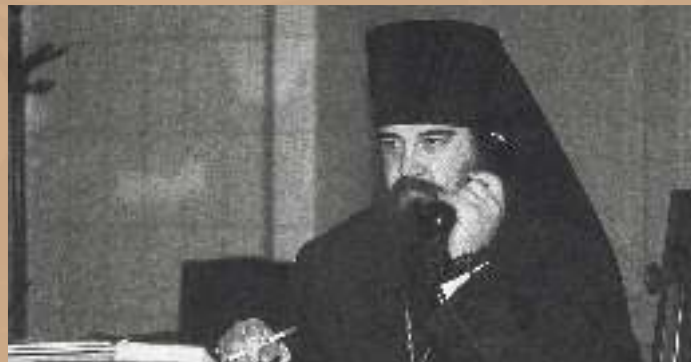
Епископ Дмитровский Филарет — ректор Московских духовных академии и семинарии 1966 г.