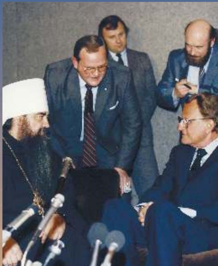
Беседа с христианским проповедником Билли Грэмом из США

«Ora et labora» — любил напоминать собеседникам владыка Филарет крылатое выражение. В самом деле, его служение в 1970-80-х годах было таким интенсивным, насыщенным и напряженным, что позднее сам владыка удивлялся, что организм выдержал бессонные ночи, бесчисленные перелеты, работу за полночь и решение многих ответственных задач. Будучи ректором академии епископ Филарет стал заместителем председателя Отдела внешних церковных сношений. Он быстро приобретал международный опыт и авторитет и в 1981 году возглавил отдел, совмещая пост с послушанием архиепископа, а позднее митрополита Берлинского и Среднеевропейского, Патриаршего Экзарха Западной Европы. В свое время владыка окормлял общины в Марокко, Австралии и Финляндии, Корсунскую епархию и др. Именно под его руководством ОВЦС готовил торжества 1000-летия Крещения Руси, ознаменовавшие новый этап в истории нашей Церкви.