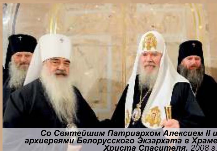
Со Святейшим Патриархом Алексием II и архиереями Белорусского Экзархата в Храме Христа Спасителя, 2008 г.

Главным достоянием прошедших лет в то время владыка называл сохранение «как внутрицерковного мира и единства, так и межконфессионального мира и взаимопонимания». Это и есть тот духовный завет, который нам, своей пастве, оставил митрополит Филарет. Ибо сынами Божиими будут наречены миротворцы (Мф. 5:9).