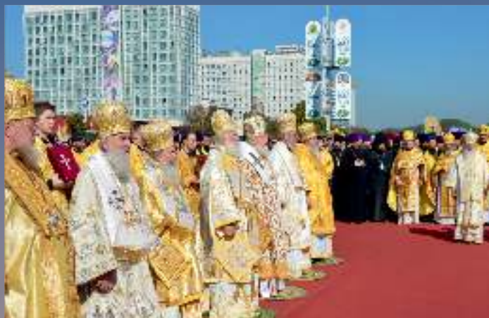
За богослужением празднования 1025-летия Крещения Руси, г. Минск, 2013 г.