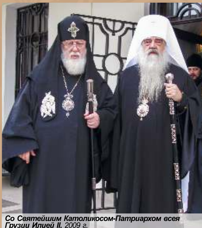
Со Святейшим Католикосом-Патриархом всея Грузии Илией II, 2009 г.