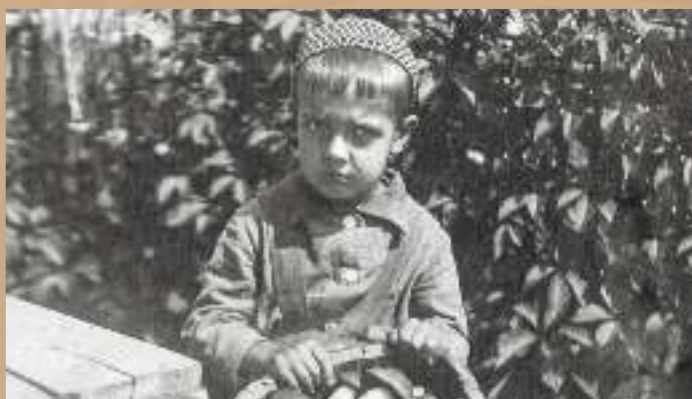
С лукошком грибов 1940 г.