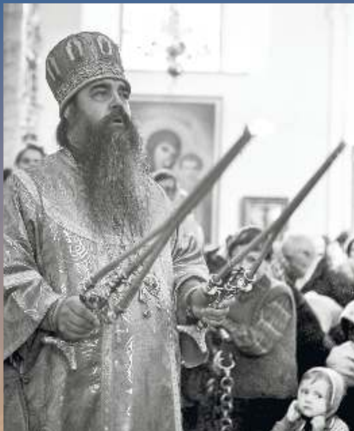
Литургия в Свято-Духовом кафедральном соборе г. Минск, 1980-е гг.