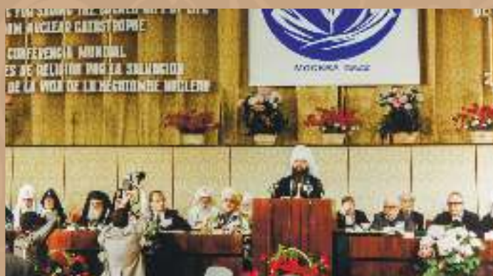
Митрополит Филарет открывает Всемирную конференцию «Религиозные деятели за спасение священного дара жизни», г. Москва, 1982 г.