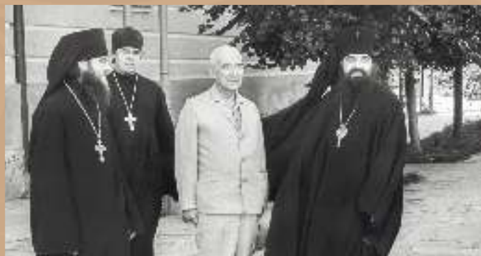
С ректором Московского государственного университета И. Г. Петровским, 1972 г.