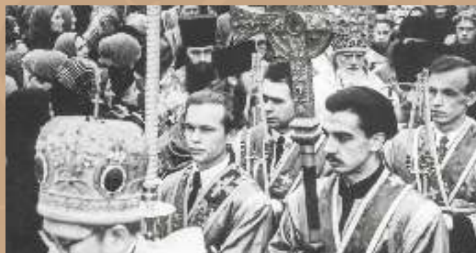
Послушание иподиакона у Святейшего Патриарха Алексия I (Симанского) конец 1950-х гг.