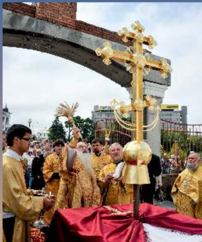
Владыка Филарет освящает накупольный крест для академического храма свт. Кирилла Туровского

Главной заботой владыки и его сподвижников стало возрождение Православия на Белой Руси и неустанные труды по открытию и устройению приходов, возобновлению монашеской жизни, духовному образованию священно- и церковнослужителей, просвещению мирян. Результатом этих трудов и одновременно импульсом к их продолжению стало учреждение в 1989 году Белорусского Экзархата с дарованием ему административной самостоятельности и собственного управления Синодом во главе с Патриаршим Экзархом. Некогда Минская кафедра, окончательно реорганизованная в 1992 году, сегодня выросла в 15 полноценных епархий с 1,5 тысячами священнослужителей и множеством верных чад Белорусской Православной Церкви. Той паствы, которая ныне, находясь под небесным покровом Собора Белорусских святых и припадая к Кресту преподобной Евфросинии Полоцкой, с благодарностью вспоминает сердечные слова своего архипастыря: «Молюсь о том, чтобы Пресвятая Владычица наша Богородица хранила белорусскую землю под Своим державным омофором».