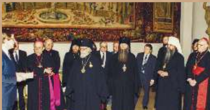
На встрече между представителями Русской Православной Церкви и Немецкой епископской конференции Римско-Католической Церкви г. Мюнхен, 1988 г.