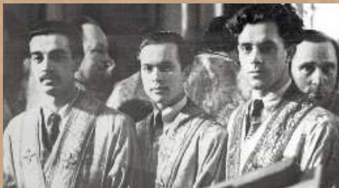
С собратьями иподиаконами конец 1950-х гг.