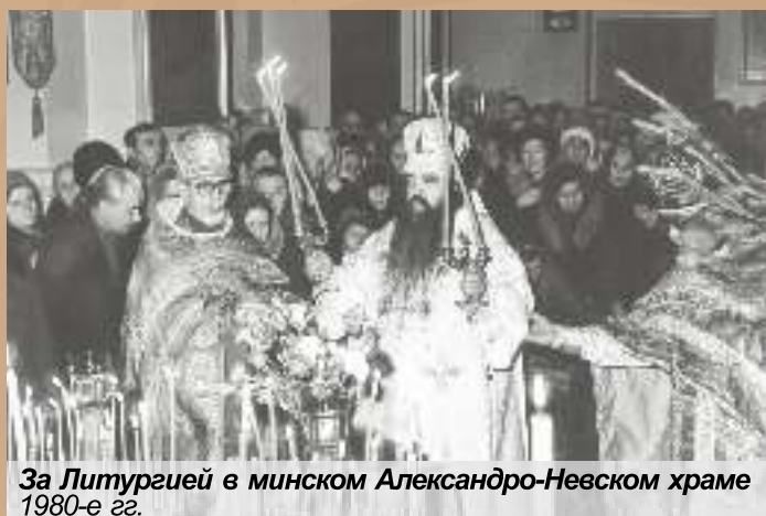
За Литургией в минском Александро-Невском храме 1980-е гг.