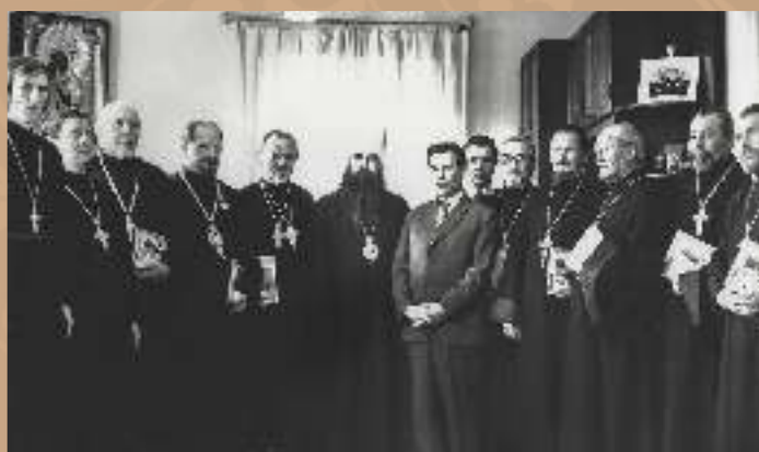
С духовенством 1980-е гг.