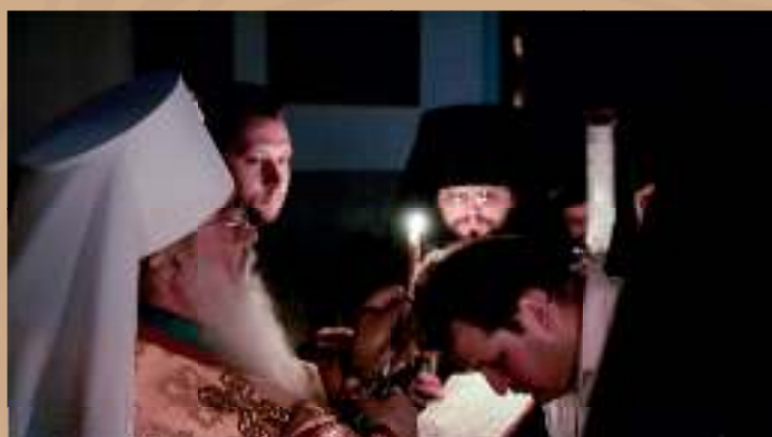
Высокопреосвященный Филарет совершает монашеский постриг