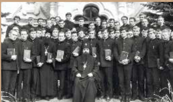
Ректор епископ Филарет со студентами 1971 г.

Митрополит Филарет часто упоминал о важности преемственности традиций, живого духовного опыта, который передается от старцев к молодым, от умудренных к новоначальным. И предупреждал будущих пастырей и архипастырей: единственная власть, которая дана им Богом — это власть любви. «Сам Господь по любви послал Сына Своего Единородного в мир, чтобы спасти людей. Именно этой любовью должно быть уязвлено наше пастырское сердце», — говорил он.