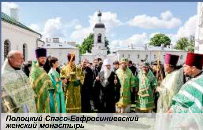
Полоцкий Спасо-Евфросиниевский женский монастырь