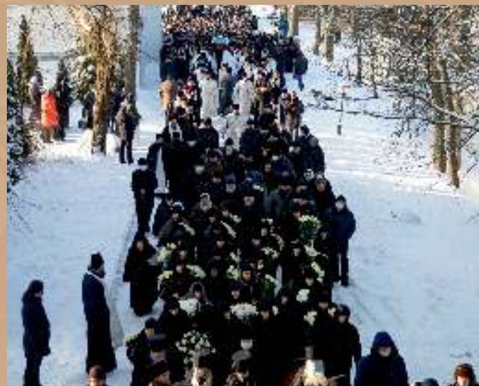
Прощание с митрополитом Филаретом в Жировичском Свято-Успенском мужском монастыре 15 января 2021 г.