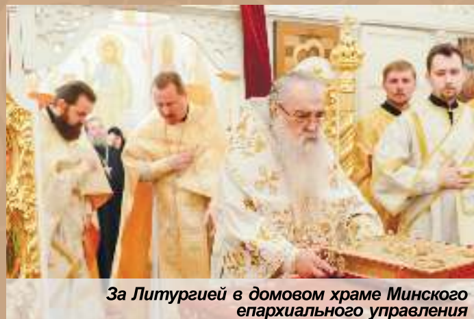
За Литургией в домовом храме Минского епархиального управления