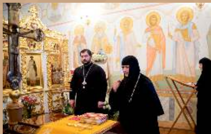
Прощание с митрополитом Филаретом в Минском епархиальном управлении, 13 января 2021 г.