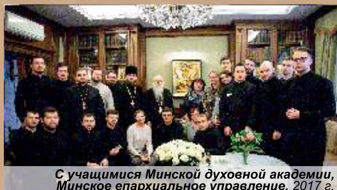
С учащимися Минской духовной академии, Минское епархиальное управление, 2017 г.