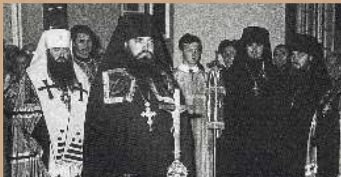
Чин наречения архим. Филарета во епископа Тихвинского. На заднем плане — митр. Никодим (Ротов) с архиереями, 23 октября 1965 г.