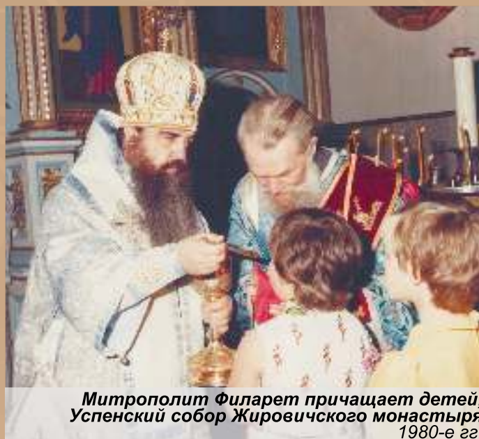
Митрополит Филарет причащает детей, Успенский собор Жировичского монастыря 1980-е гг.