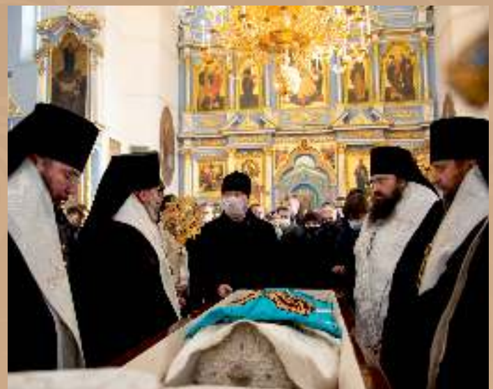
Прощание с митрополитом Филаретом в Жировичском Свято-Успенском мужском монастыре 15 января 2021 г.