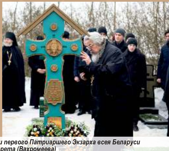
Богослужения в сороковой день по преставлении первого Патриаршего Экзарха всея Беларуси митрополита Фиаларета (Вахромеева) 20 февраля 2021 года