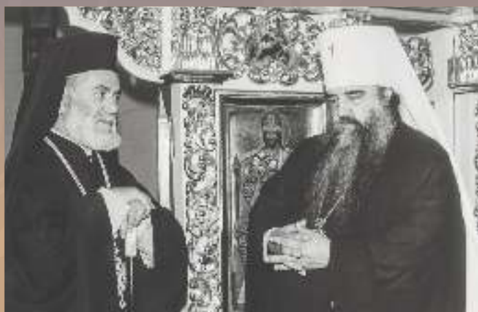
С Блаженнейшим Патриархом Антиохийским и всего Востока Игнатием IV в храме в честь Собора Белорусских святых, 1989 г.