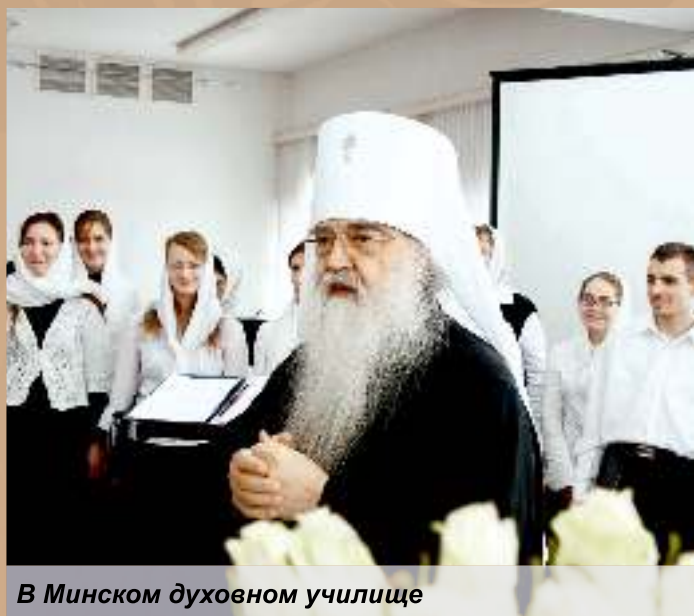
В Минском духовном училище