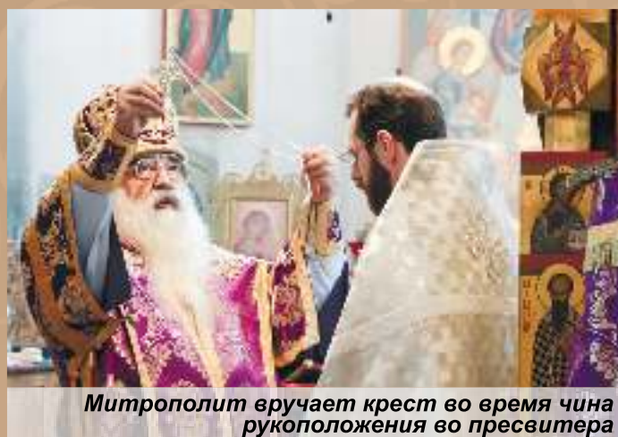
Митрополит вручает крест во время чина рукоположения во пресвитера