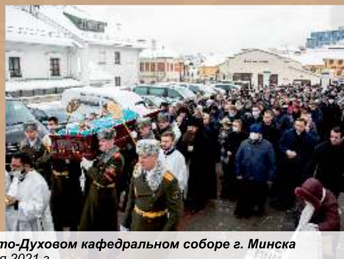
Прощание с митрополитом Филаретом в Свято-Духовом кафедральном соборе г. Минска 13-14 января 2021 г.