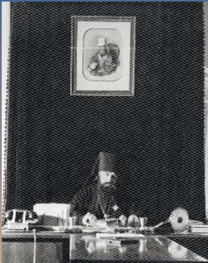
В рабочем кабинете