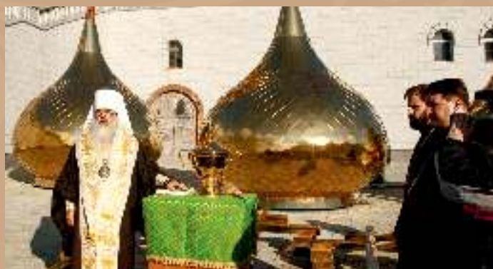
Патриарший Экзарх совершает освящение куполов для строящегося Всехсвятого храма в г. Минске