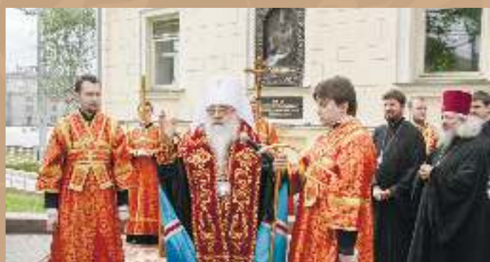
Открытие мемориальной доски с барельефным изображением митрополита Мелхиседека (Паевского) на здании Института теологии