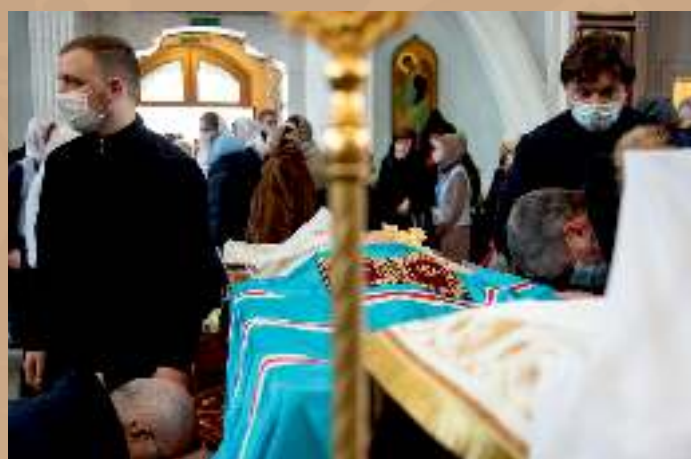
Прощание с митрополитом Филаретом в Свято-Духовом кафедральном соборе г. Минска 13-14 января 2021 г.