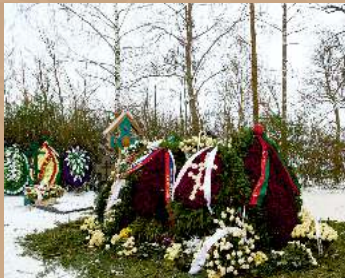
Прощание с митрополитом Филаретом в Жировичском Свято-Успенском мужском монастыре 15 января 2021 г.