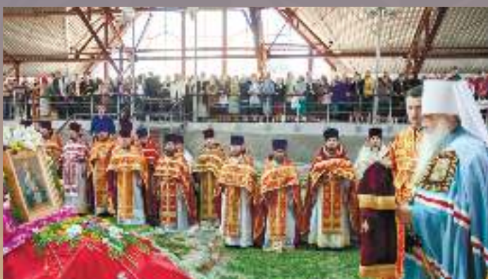
Богослужение на древнем замчище XI-XIII вв. г. Туров