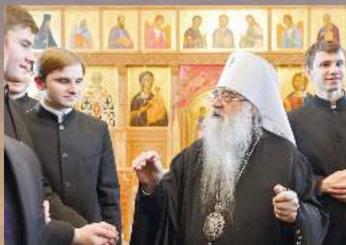
Владыка Филарет благословляет семинаристов