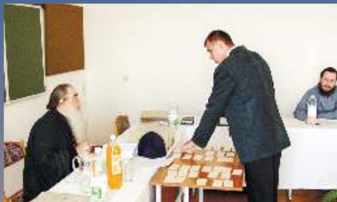
На экзамене в Минской духовной семинарии

Мы, современники, с трудом представляем, что всего несколько десятилетий назад в Беларуси не было ни воскресных школ, ни духовных училищ, ни даже семинарии, окончательно закрытой в «хрущевскую оттепель». Возрождение Минской духовной семинарии начиналось с кратких курсов, а по сути — пастырских встреч в Жировичах. Сегодня в Белорусском Экзархате выстроена полноценная и всесторонняя система духовного образования с семинариями, теологическим институтом, училищами и школами. А в сердце Минска, близ кафедрального собора, осуществленный замысел последних лет — Духовно-образовательный центр Белорусского Экзархата. Его средоточием является Минская духовная академия и Институт теологии БГУ, центры богословского образования и просвещения в Беларуси. «Это — милость Божия. Особых заслуг никто себе приписывать не должен», — так говорил владыка Филарет о втором рождении духовной школы. И отмечал, рассказывая о значении для Беларуси духовных школ: «Мы — малое стадо, малое общество, но — с большим духовным потенциалом».