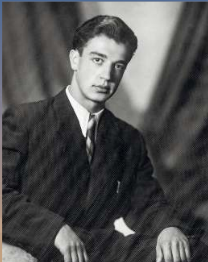
Кирилл Вахромеев вторая половина 1950-х гг.

Учебу в семинарии Кирилл Вахромеев совмещал с послушанием иподиакона у Патриарха Алексия I, а на втором курсе духовной академии принял постриг. Небесное покровительство праведного Филарета Милостивого и святителя Филарета (Дроздова) вдохновляло труды молодого богослова: он остался преподавать, был назначен инспектором академии, затем заведующим аспирантурой. 24 октября 1965 года митрополит Никодим (Ротов) со архиереями хиротонисал архимандрита Филарета во епископа Тихвинского, викария Ленинградской епархии. Спустя полгода, уже будучи епископом Дмитровским, викарием Московской епархии, владыка Филарет возглавил Московскую духовную академию. И стал самым молодым ректором в послевоенный период, оставив после себя добрую память как у преподавателей, так и у студентов.