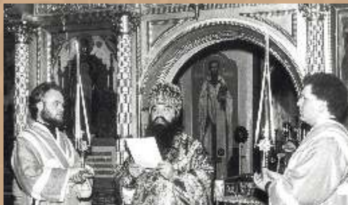
За богослужением, Пасха 1972 г.