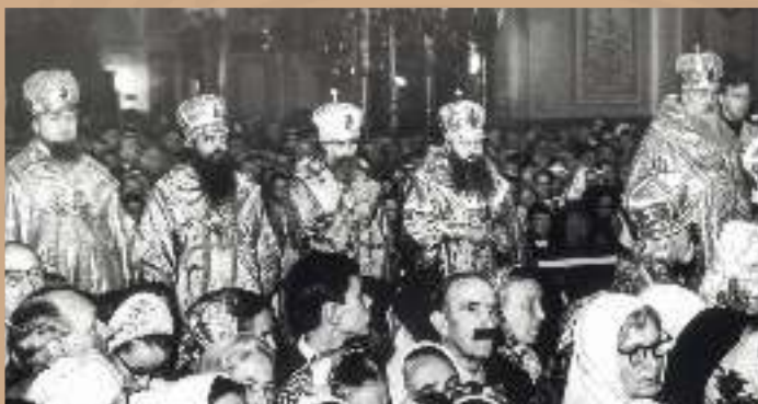
За литургией с Патриархом Московским Пименом, митрополитом Никодимом (Ротовым), митрополитом Антонием (Блумом)